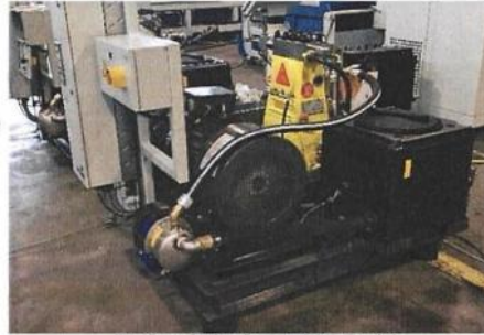
Beispiel einer HDP 44

Fabrikat : Ridder - Deutschland - Type : WARI-tpx – ohne Schutzhaube installierte Antriebsleistung : 45 kW bei 1500 min -1 min. Wasservordruck : 3 bar max. Wassertemperatur : 40 °C Fördermenge : 0,7 – 6,4 l/min Auslegungsdruck : max. 3800 bar Motordrehzahl : 150 – 1800 u/min. Abmaße HxBxL : 1600 x 1500 x 1800 mm (ohne Einhausung)